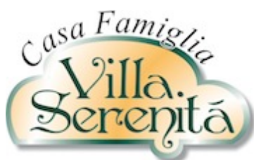
Casa Famiglia Villa Serenità