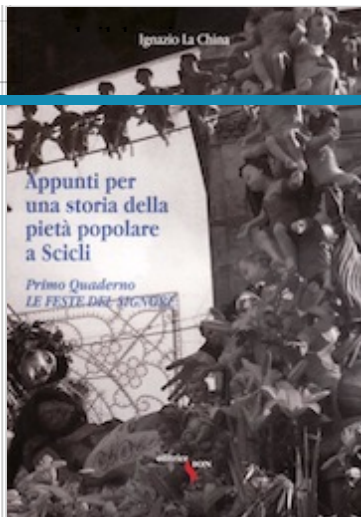
Ignazio La China, Appunti per una Storia della Pietà popolare a Scicli, Editrice Sion